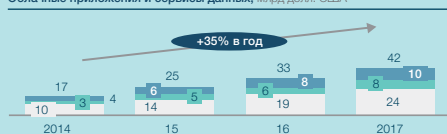
Облачные приложения и сервисы данных, млрд долл. США